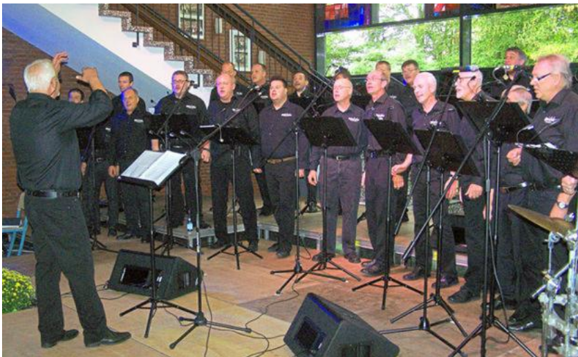
Ein Heimspiel genossen die „White Sox“.

Ascheberg - Vor ausverkaufter Aula der Realschule schlugen die „White Sox“ einen weiten musikalischen Bogen. Unterstützt wurden sie vom Popchor Breckenheim aus Wiesbaden. Geboten wurde nicht nur ein Konzert, sondern auch etwas Comedy.